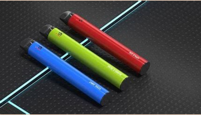
Sigaretta elettronica usa e getta

Una sigaretta contiene circa 4000 sostanze chimiche di cui 400 tossiche