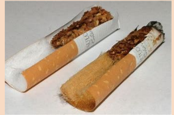
Classiche sigarette (aperte)