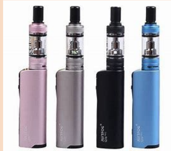
Sigaretta elettronica classica